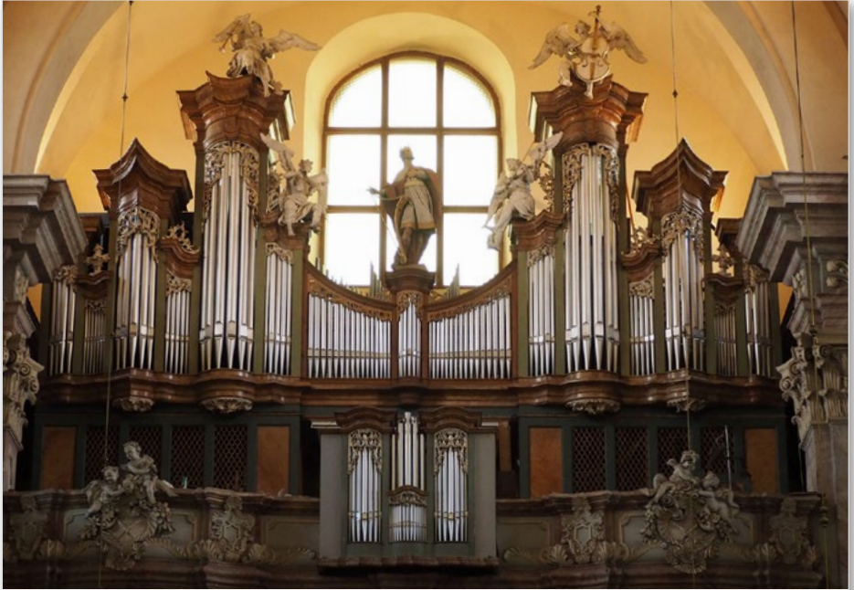
Kostel sv. Vojtěcha v Opavě | Church of St. Vojtěch in Opava