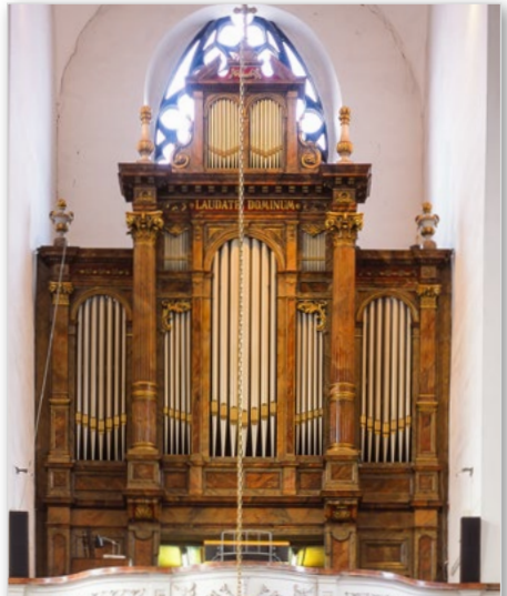
Konkatedrála Nanebevzetí Panny Marie v Opavě Co-cathedral of the Assumption of the Virgin Mary in Opava