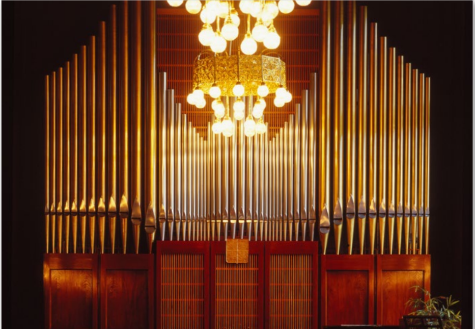
Knihovna Petra Bezruče v Opavě | Petr Bezruč Library in Opava