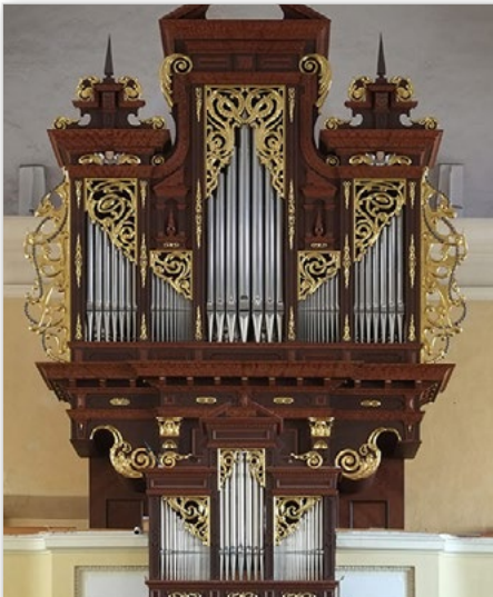
Kostel sv. Jana Křtitele v Hlučíně Organ in the Church of St. John the Baptist in Hlučín